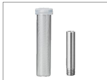
左：融点測定用毛細管 右：温度計サポート

※温度補正は付属品の温度計サポートを使用し、別売の水銀温度計を本体にセットして行います。