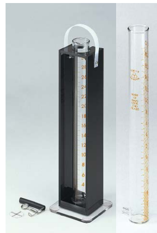
ガラス製比色管付 30型セット