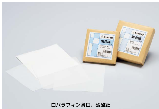
白パラフィン薄口、硫酸紙