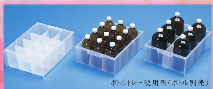
ボトルトレー使用例(ボトル別売)