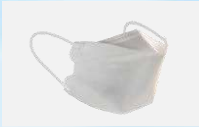
クラレ クラスペースマスク EB