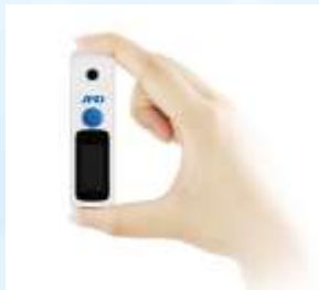
手のひらサイズのコンパクト設計

測定精度: Brix ±0.2%、温度 ±1℃ 測定時間: 約3秒 外寸法: W23×D14.5×H84mm 重量: 約24g (本体のみ) 電源・電池寿命: 内蔵充電電池 (350mA/h) ・約1700回 (満充電にて) 付属品: USB-Cケーブル、収納ポーチ、スポイト2本、ストラップ、クリーニングクロス