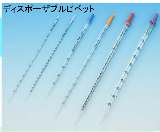
ディスポーザブルピペット