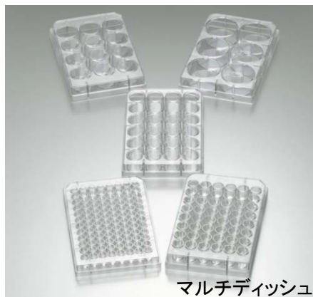
マルチディッシュ