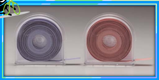
リトマス試験紙 ロールタイプ