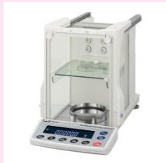
BMシリーズ (BM252・マイクロを除く)