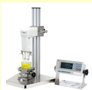
粘度計SVシリーズ (SV-A/HIは除く)