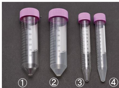
①③ポリスチレン(PS)製、②④ポリプロピレン(PP)製