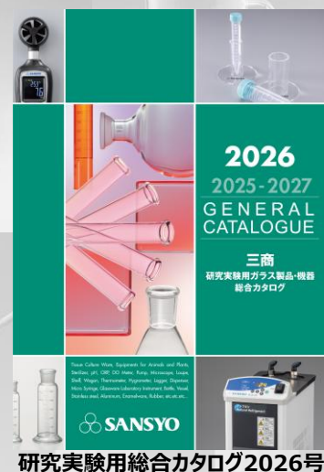
研究実験用総合カタログ2026号

最新カタログ掲載の弊社オリジナル新商品・おすすめ商品をご紹介します キャンペーン対象商品は最大30%OFFにてご提供致します！