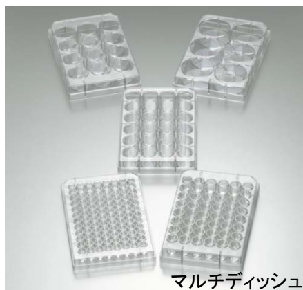
マルチディッシュ