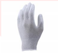
ESDプロテクトパーム