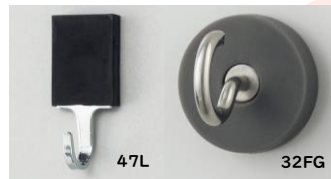
シリコンフックマグネット