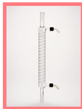
冷却管 グラハム型