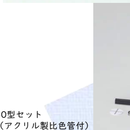
50型セット (アクリル製比色管付)

セット内容：アクリル製比色管、プラスチックスタンド、標識板、ピンチコック、黒ゴム管No.7