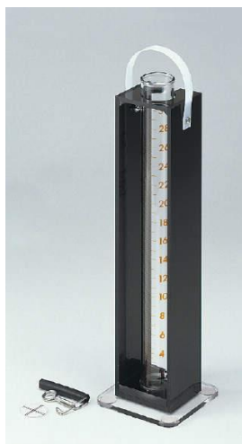
30型セット (ガラス製比色管付)