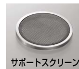
サポートスクリーン