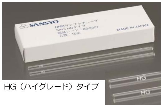
HG (ハイグレード) タイプ