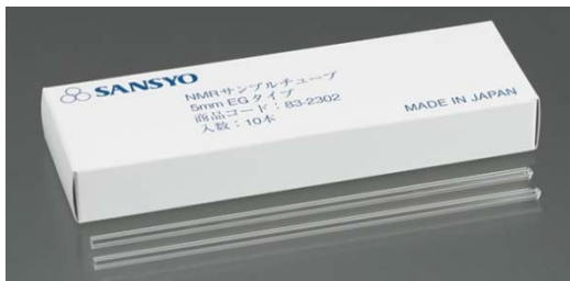
EG (エコノミーグレード) タイプ

内径： \phi 4.220^{+0.01} mm 肉ムラ： 40\mu\text{m}