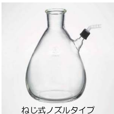
ねじ式ノズルタイプ