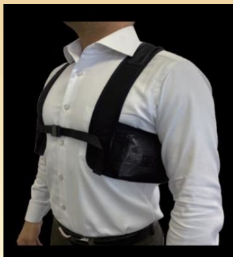
保冷インナー着用例